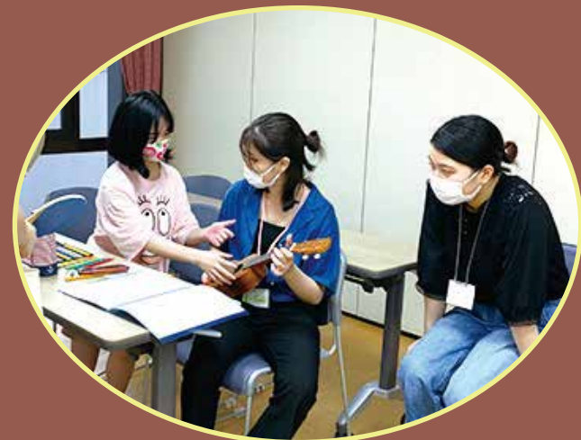
みんなのやりたいことをしながら、まったり過ごしています。

世田谷区と協定を結んでいる昭和女子大学の学生と日本大学文理学部の学生が主体となって運営をしている若者の居場所です。アップスが運営のサポートしています。