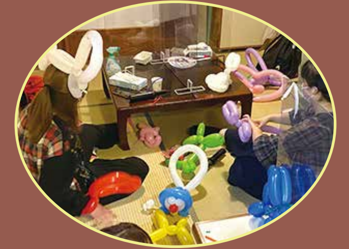
大学生が企画したイベントをやる日もあります！

たからばこは上北沢にある「岡さんのいえ TOMO」を借りて行っている、中高生世代の居場所です。過ごし方は人それぞれ！ふらっときて、居合わせたみんなとボードゲームをしたり、勉強を試してみたり。何もしなくても大丈夫。思い思いの時間を過ごしにぜひ来てください。