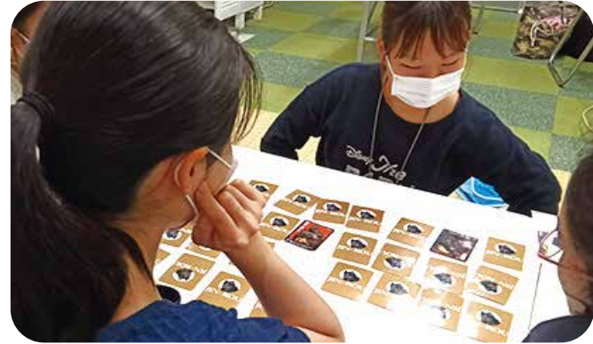
人狼ゲームイベントをやった時に、皆ルールがわからなくて神経衰弱を試みたらかなり盛り上がりました♪