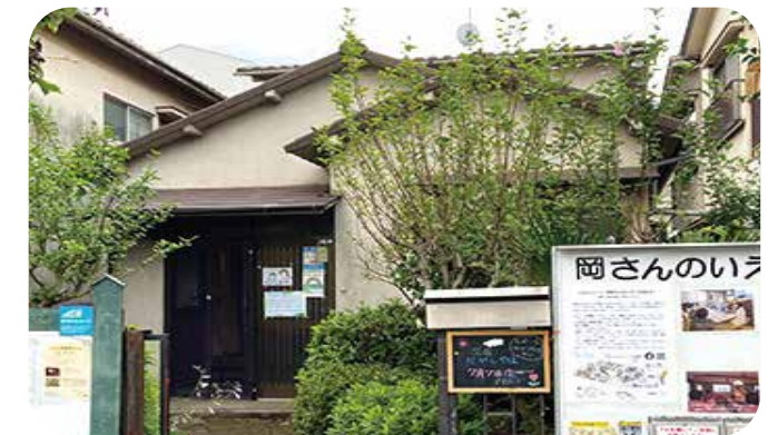
多世代交流の場として親しまれている「岡さんのいえ TOMO」を利用して居場所を運営しています。